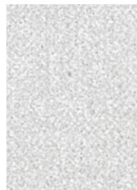
Art.-Nr.: FM100.004 (Kevlar, silber/gelb)