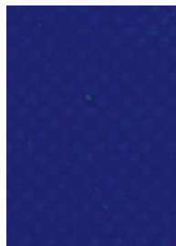
Art.-Nr.: FM100.003 (PVC, blau)