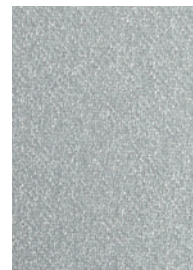
Art.-Nr.: FM100.005 (PP, weiß, FDA)