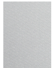
Art.-Nr.: FM100.006 (PBT, weiß)