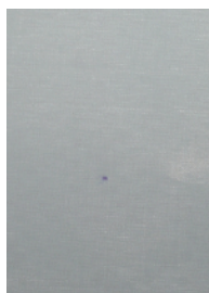
Art.-Nr.: FM100.008 (PET, weiß, FDA)