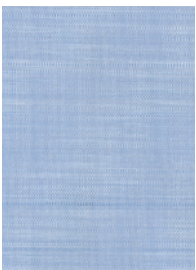
Art.-Nr.: FM100.001 (PE, blau)